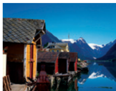
Vakre Fjærland.