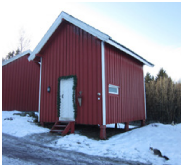
Stabbur fra 1900, Horten