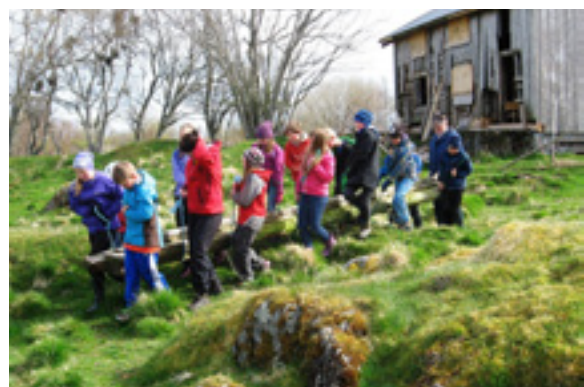
Femteklassinger fra Vega i arbeid ved Grotlandshuset.