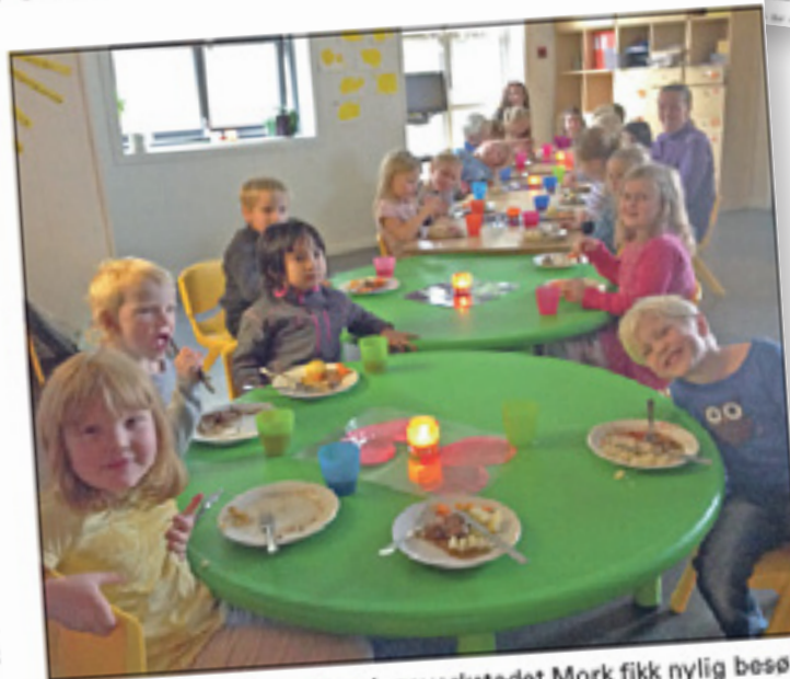
MATDAG. Barnehagen Læringsverkstedet Mork fikk nylig besøk av en mesterkokk. Det falt i smak.

De likte veldig godt ferskosten som passet til dessert, men de