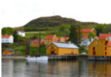
Hamnvik handelssted ble etablert i 1794. Her kan du oppleve gammel storhetstid og kystkultur.