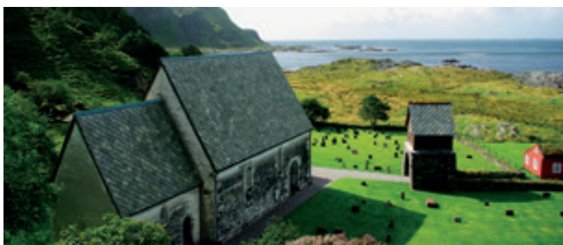
Kinn med Kinnaklova i bakgrunnen.

Vi har invitert alle fylkeskommunane til å presentere nokre eksempel på det det vi har kalla «dei kulturelle omvegar» i dette nummeret av Kulturarven, der vi har vore ute etter kulturhistoriske attraksjonar som kan gi oppleving og kanskje «medleving» for turistar.