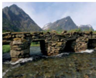
Svede bru på Øye.