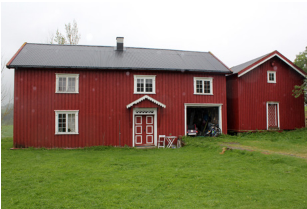
Skolestue og våningshus fra 1700, Levanger