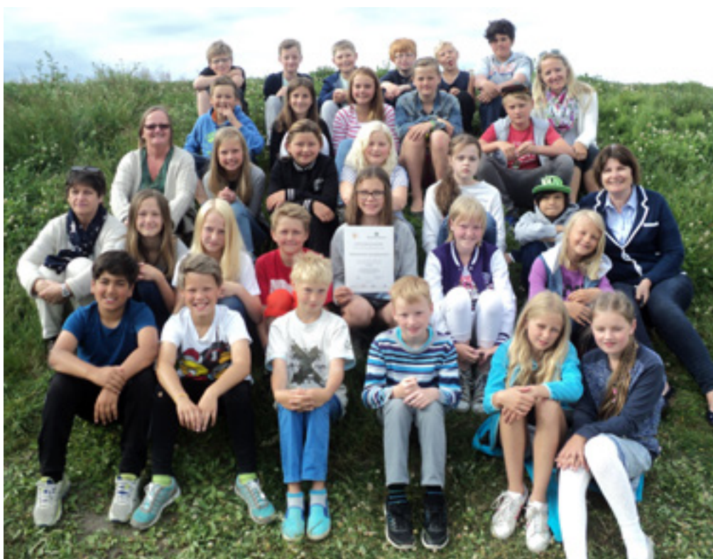
Lærere og elever fra 5. trinn ved Halmstad barne- og ungdomsskole.

Den prisbelønte aksjonen «Rydd et kulturminne» ble gjennomført for sjuende gang i løpet av skoleåret 2013–2014. Over 2700 barn og unge har gjennom skoler, lag og foreninger deltatt i aksjonen og sørget for tilgjengeliggjøring og vedlikehold av kulturminner over hele landet.