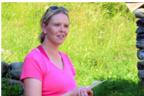
Statsråd Sylvi Listhaug