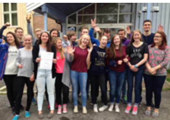
Glad gjeng fra Bardu ungdomsskole med diplom etter vel utført arbeid.