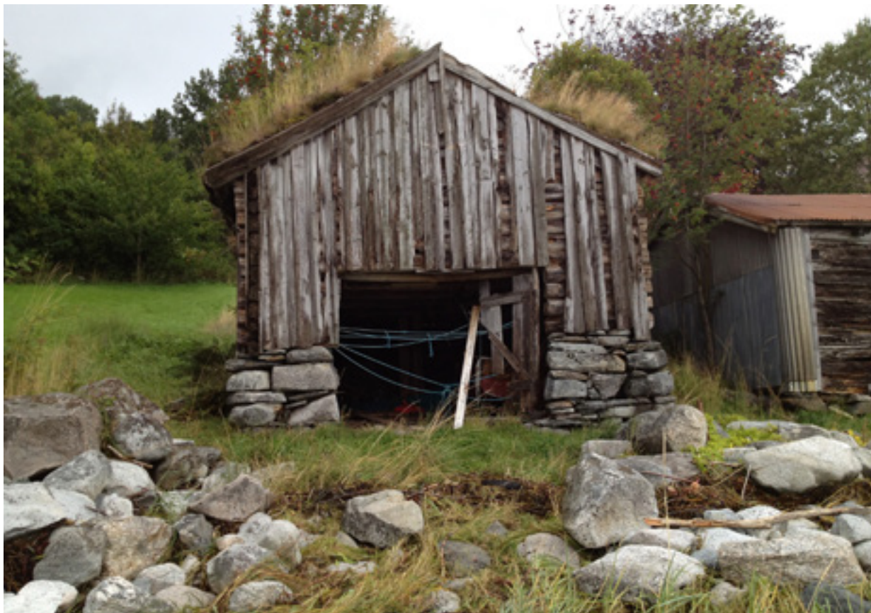
Nauslœe frå 1850, Surnadal

287 søknader om tiltak for å berge forfallstrua bygningar av kulturhistorisk verdi og 29 søknader om tilskot til el-kontroll kom inn før søknadsfristen 1. februar. Aksjonen i år rettar seg mot våningshus og driftsbygningar, og det er Stiftelsen UNI som har bidratt med kr 1,2 mill. Av dette er kr 450 000 øyremerkt til el-kontroll. Rundt 45 % av søknadene gjeld våningshus og seterhus, 45 % ulike slags driftsbygningar og 10 % naust, jaktbuer, skulehus og nokre heilt spesielle anlegg som f.eks. klokkestøyper, lysthus og dokkestue.