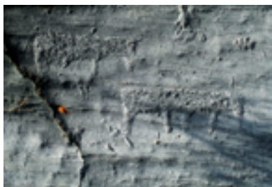
På feltet Kirkely ble det i 2010 oppdaget flere nye helleristninger