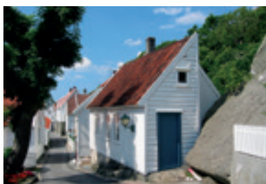
Seilskutebyen Skudeneshavn.