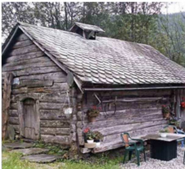
Årestue fra 1600, Voss