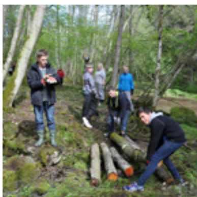
8. klasse ved Vårteig rydda ved Kullerudbekken.